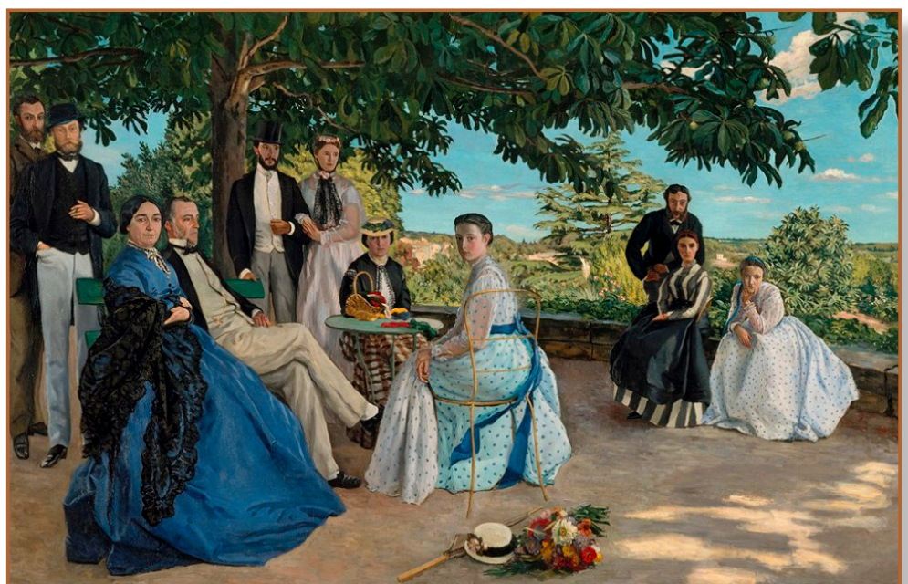
La Réunion de Famille